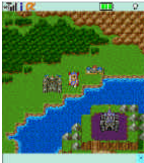
【ドラゴンクエスト】 フィールド画面