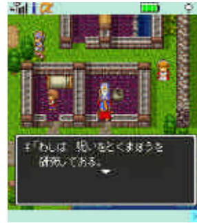
【ドラゴンクエスト】 町画面