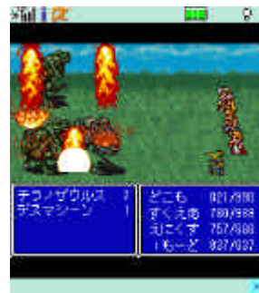
【ファイナルファンタジー】 バトル画面