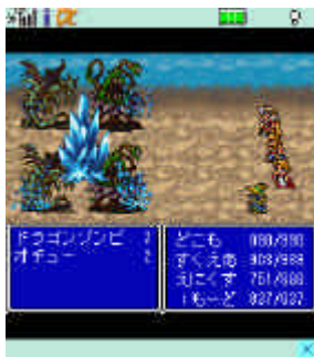
【ファイナルファンタジー】 バトル画面