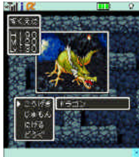
【ドラゴンクエスト】 バトル画面