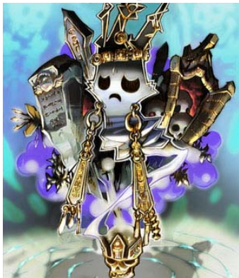
板鼻 利幸 「FINAL FANTASY リング・オブ・フェイト」