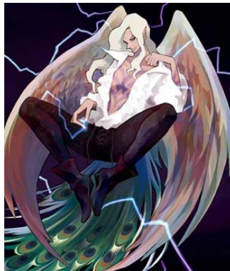
天野 シロ 「月刊 少年ガンガン キングダムハーツ」