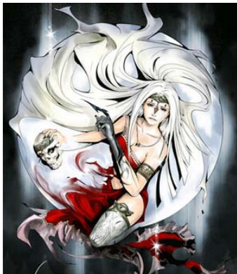
直良 有祐 「ラスト レムナント」