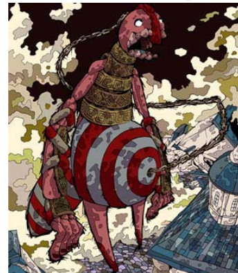
大久保 篤 「月刊少年ガンガン ソウルイーター」