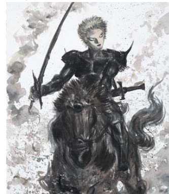
天野 喜孝 「FINAL FANTASY シリーズ」