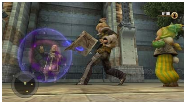
時にはこんなイタズラも！？