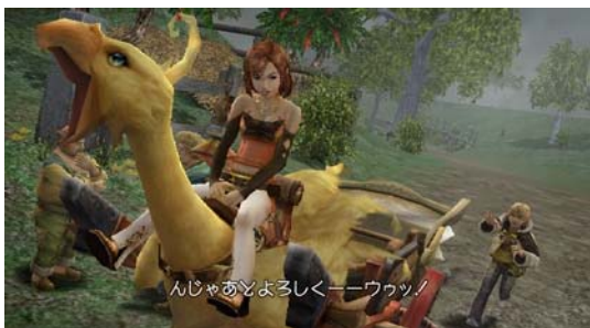
通常のイベントシーンからシームレスでプレイアブルイベントへ。

本作ではイベントシーンをただ見るのではなく、数々の場面において“イベントシーンをプレイする”事になります。「ファイナルファンタジー」シリーズらしいイベントシーンの数々を、まるでプレイヤーが主人公になりきったかの如く“Wiiならではの直感的な操作でヒロイックなアクションを体感”し、これまでに経験したことのない、臨場感あふれるストーリー展開を存分に楽しんでいただけます。