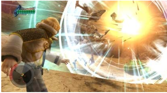
魔物とのバトルも引力を駆使して戦っていく。

本作では、フィールド上で繰り広げられる魔物とのバトル、ゲーム内キャラクターとのコミュニケーション、そして多彩なアクションの全てを、レイルが持つ引力を操る力を駆使してプレイしていくことになります。さらに、フィールド上に存在する様々な対象物は、プレイヤーがWiiリモコンとヌンチャクを操作して起こすアクションに対し、驚きや緊張感に満ちた、そして時には笑えるリアクションを起こします。プレイヤーが思いのままに世界に触れるほど、新たな発見と驚きに出会う。それが「ファイナルファンタジー・クリスタルクロニクル クリスタルベアラー」の醍醐味です。