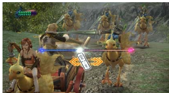
見るだけでは無い、臨場感あふれるストーリー展開が楽しめる。