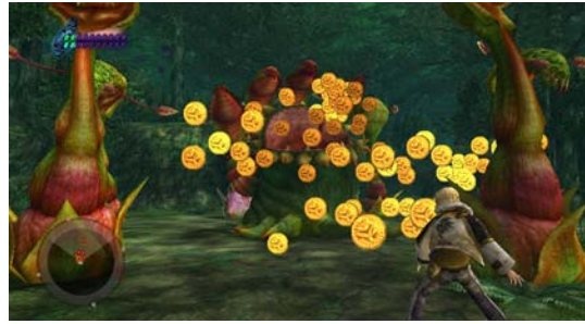
レイルのアクションに対し返ってくる様々なリアクション。