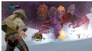
魔物のリアクションを使った戦い方も可