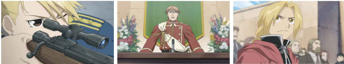
※すべての画像は開発中のものとなります。