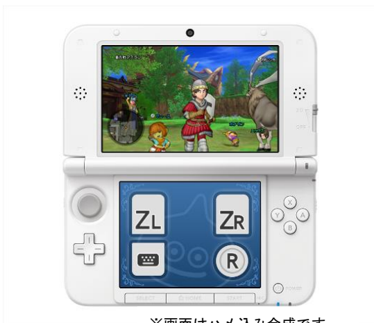
※画面はハメ込み合成です。