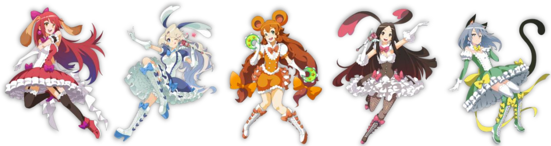
ガレット・デ・ロウ プリン・ア・ラ・モード ブッシュ・ド・ノエル ガトー・オ・ショコラ パオン・デ・ロー

「ブレブリー」シリーズのPCブラウザゲーム「ブレブリーデフォルト プレイングブレイジュ」で登場する「プリティケイクス」たちが仲間になるチャンス！