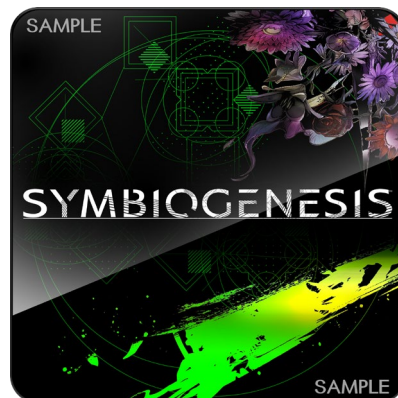
<「メンバーカード グリーン」サンプル>

※『SYMBIOGENESIS』の対応ウォレットはMetaMask、WalletConnect、Web3Authです。