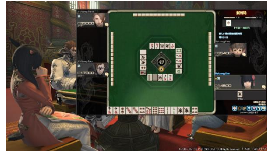
<「ファイナルファンタジーXIV」 ゲーム画面での「ドマ式麻雀」プレイ風景>

また、1月22日から池袋パルコで開催する『咲-Saki-』15周年記念展」では、シリーズのイラストやフォトスポット・サインの展示、「実写版 咲-Saki-阿知賀編 episode of side-A」の撮影で使用された衣装・台本などの展示、さらにTwitter投票でデザイン決定したタペストリーをはじめとする各種グッズの販売などを行います。記念展の概要は https://magazine.jp.square-enix.com/yg/special/2011_saki15th/ をご参照ください。