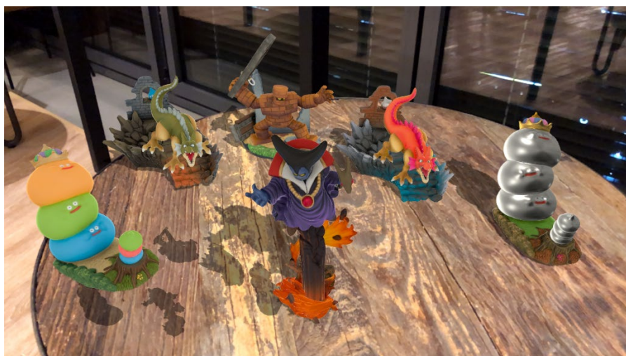
AR フィギュアイメージ