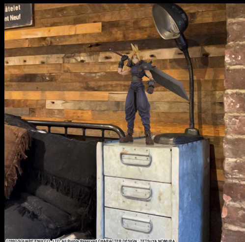
©1997 SQUARE ENIX CO., LTD. All Rights Reserved. CHARACTER DESIGN: TETSUYA NOMURA