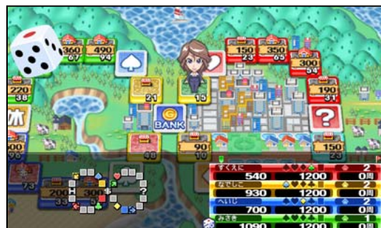
「いただきストリート Smartphone (仮)」