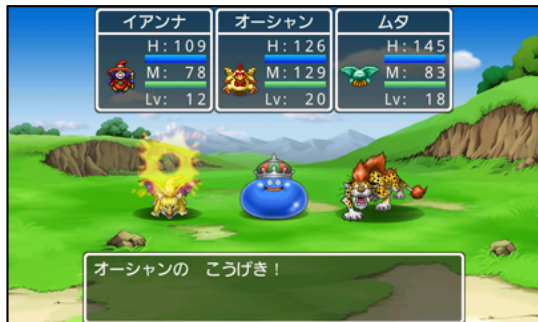
「ドラゴンクエストモンスターズ WANTED!」