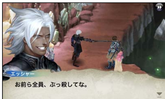
「ケイオスリングス」