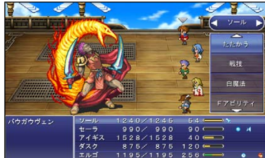
「ファイナルファンタジーレジェンズ 光と闇の戦士」