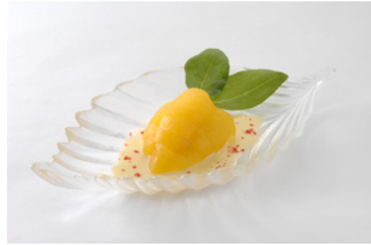
<女神の果実 ~パニラアイスを添えて~>