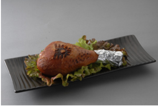
<ギガンテスのこんぼう>