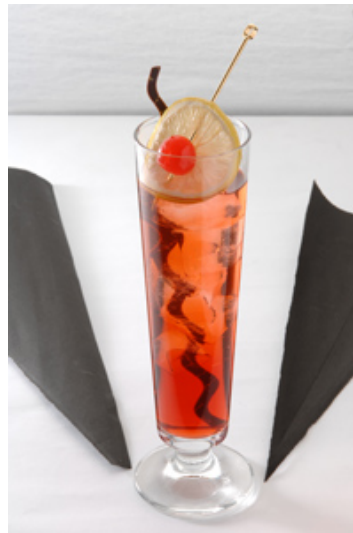
<パッションメラゾーマ>