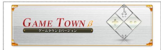
【ゲームタウン βバージョンのロゴ】

株式会社スクウェア・エニックス（本社：東京都渋谷区、代表取締役社長：和田 洋一、以下スクウェア・エニックス）は、5月24日より、当社が運営する無料の会員制サービス「スクウェア・エニックス メンバーズ」のサイト上で、当社のゲームをモチーフにしたミニゲームを無料でお楽しみいただける新サービス「ゲームタウン βバージョン」を開始しました。