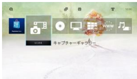
▲Amazon.co.jp 限定ダイナミックテーマ (PS4)

PlayStation®4/Amazon.co.jp限定「いけにえと雪のセツナ」ダイナミックテーマ PlayStation®Vita/Amazon.co.jp限定「いけにえと雪のセツナ」オリジナルテーマ