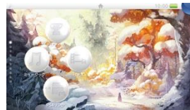
▲Amazon.co.jp 限定オリジナルテーマ (Vita)