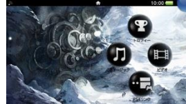
▲e-STORE 限定オリジナルテーマ (Vita)