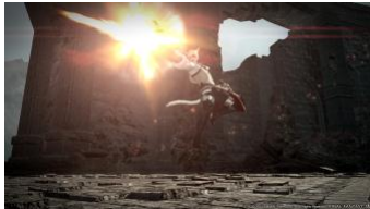
銃と機工兵器を駆使する新ジョブ「機工士」