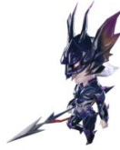
ミニオン マメット：カイン