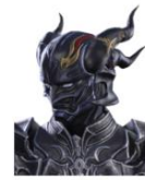
バロンヘルム（セシル暗黒騎士 ver）