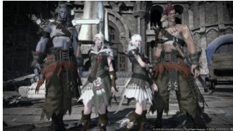
プレイヤー種族に追加となる「アウラ」