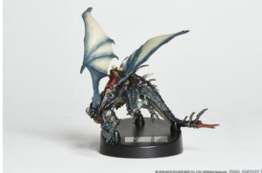
コレクターズエディション パッケージ版 特典のドラゴンマウント ハイクオリティフィギュア