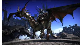
フライングマウント「ドラゴン」