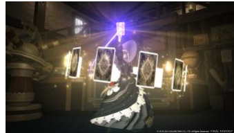
天球儀と運命のカードを用いる新ジョブ「占星術師」