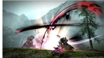
大剣を手に戦う新たなジョブ「暗黒騎士」