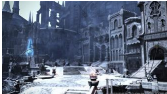
冒険の舞台となるイシュガルド市街