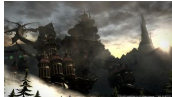
追加となるレイドダンジョン「機工城アレキサンダー」