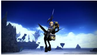
フライングマウント「黒チョコボ」