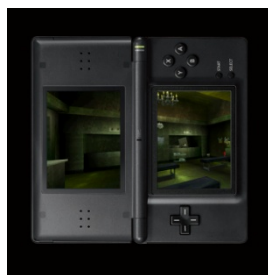
ナナシ ノ ゲーム

「バーチャル×リアルな恐怖が融合する、新しい恐怖体験エンターテインメント」 特別限定イベント「戦慄迷宮 4.0 ナナシ ノ シタイ」が完成