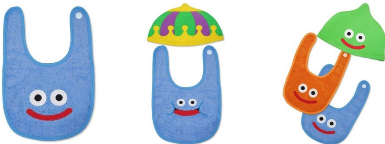
© ARMOR PROJECT/BIRD STUDIO/SQUARE ENIX All Rights Reserved. ドラクエベビー&キッズ スタイ スライム 1,800円 (税抜)