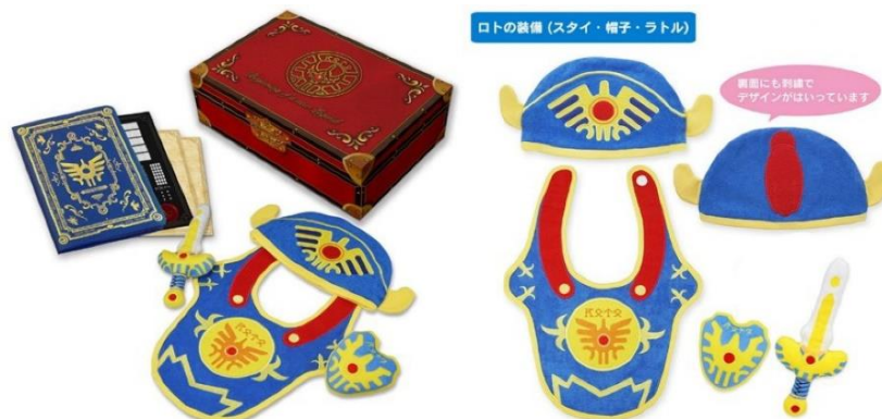
ロトの鎧（スタイ・帽子・ラトル）