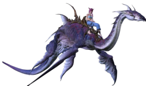
マウント シルドラ