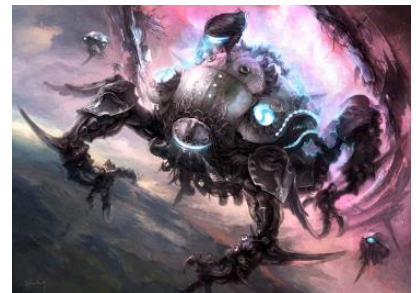
次元の狭間“オメガ”イメージアート

大迷宮バハムート、機工城アレキサンダーに続く第3の高難易度レイドタイトルが、「次元の狭間“オメガ”」であることが発表されました！既にFFXIVのメインシナリオ上で「オメガ」という名称は幾度か登場しており、ついにその脅威がエオルゼアに現れます。果たしてその出現はどのようなものなのか、「次元の狭間」とは何を意味するのか、これからのシナリオ展開や情報公開にご期待ください！