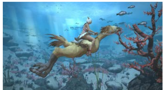
フライングマウントは潜水移動も可能