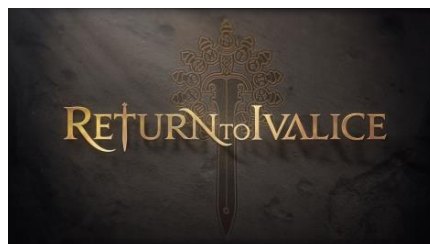
リターン トゥ イヴァリース (コンテンツロゴイメージ)

世界的クリエイターである両氏を迎えて、さらに飛躍するFFXIVにご期待ください。