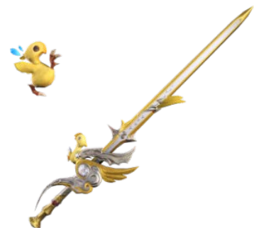
赤魔道士専用武器 チキンナイフ