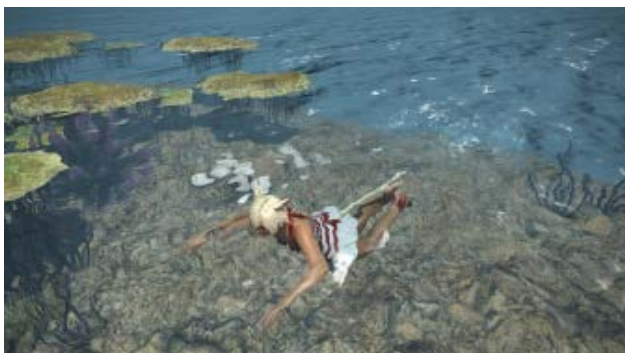
通常速度での泳泳「平泳ぎ」

エオルゼアの世界に、新たなゲーム体験「水中アクション」が加わります！「紅蓮のリベレーター」のリリースに合わせ、エオルゼアに存在する海や川、そして湖などを泳いだり、潜ったりすることが可能になります。これらは泳ぐことが可能なエリアへの侵入で、自動的にアニメーションが切り替わり、プレイヤーに新たなゲーム体験を提供します。従来のエリアにも一部泳ぐことが可能なエリアが設定されるため、海岸エリアのコスタ・デル・ソルなどで、FFXIVをはじめたばかりの方でもお楽しみいただけます。