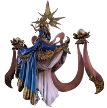
蛮神「美神ラクシュミ」(CG)