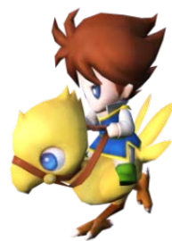
ミニオン マメット・パッツ